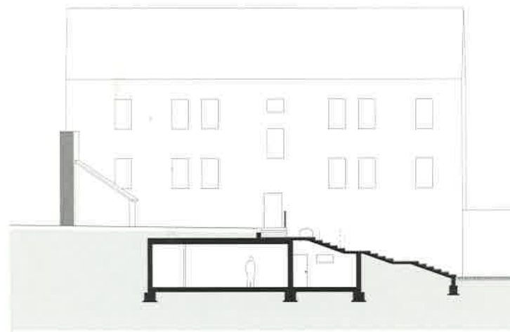
SCHNITT A-A_SECTION A-A